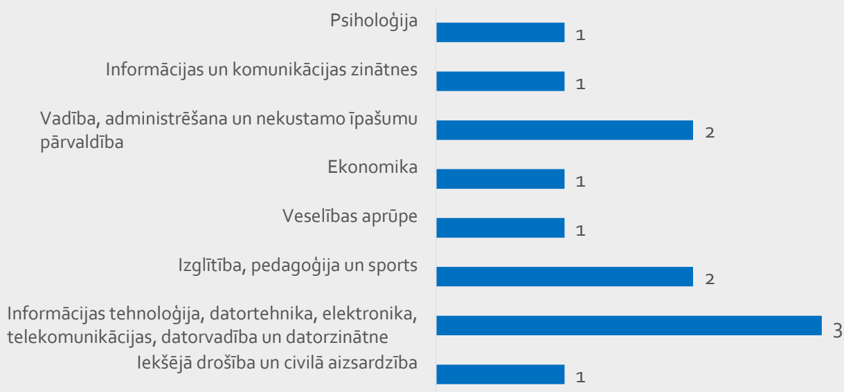
1.2. Attēls Licencēto studiju programmu sadalījums pa studiju virzieniem

No visām licencētajām studiju programmām lielākais licencēto studiju programmu skaits bija studiju virzienā "Informācijas tehnoloģija, datortehnika, elektronika, telekomunikācijas, datorvadība un datorzinātne". Visu licencēto studiju programmu sadalījums pa studiju virzieniem norādīts 1.2. attēlā.