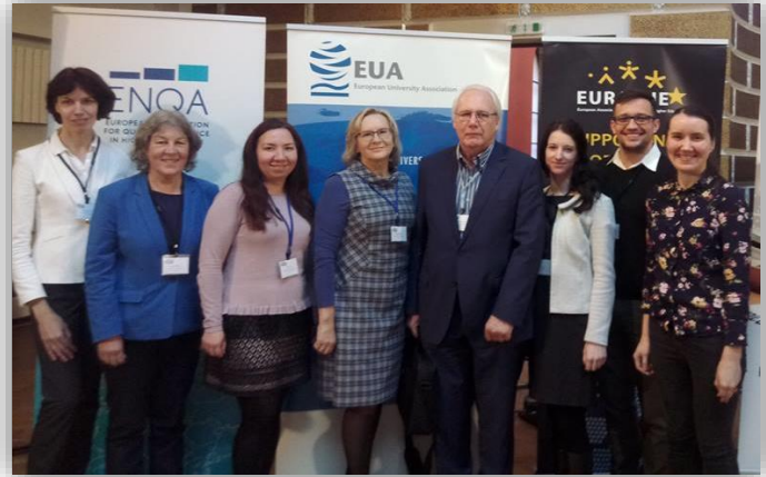
Aģentūras pārstāvji EQAF, 2017, Rīga

Šogad foruma vadmotīvs bija – Atbildīga kvalitātes nodrošināšana ( Responsible QA: Committing to impact ). Forumā darbs bija organizēts trīs dienu garumā, piedāvājot ļoti plašu informatīvu saturu, trīs kopējās plenārsēdēs, sešās paralēlās diskusiju sesijās, kā arī bija iespējams apmeklēt vairākas no 6 darba grupām vai 23 pētījumu prezentācijām. EQAF piedalījās augstākās izglītības kvalitātes nodrošināšanas procesā iesaistītās organizācijas, to pārstāvji, kopumā vairāk nekā 460 dalībnieki no 48 valstīm.