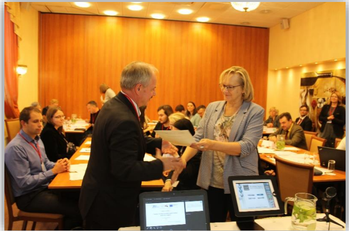
6. oktobris praktiskās mācības “Studiju virzienu novērtēšanas praktiskie aspekti”

Mācības tika organizētas ESF projekta “Atbalsts EQAR aģentūrai izvirzīto prasību izpildei”, Nr.8.2.4.0/15/I/001 ietvaros.