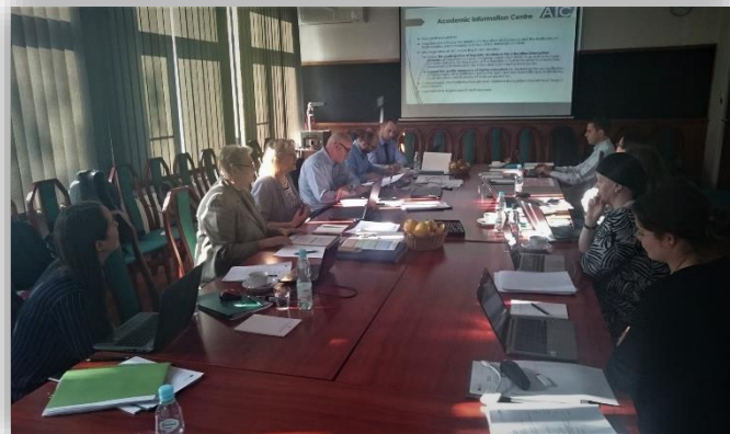
DASCHE projekta sanāksme (oktobris)

Informācija par DASCHE projektu pieejama