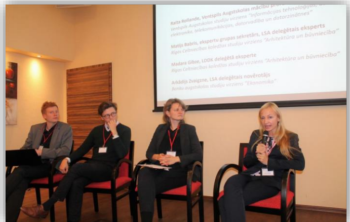
20. aprīlis paneldiskusija par ekspertu pieredzi novērtēšanas procedūrās

Ekspertu praktiskās mācības tika organizētas grupās, katrā iekļaujot piecus ekspertus (t.sk. studējošo un darba devēju pārstāvjus), kas atbilst ekspertu skaitam studiju virzienu novērtēšanas ekspertu grupā. Atbalstu grupām sniedza Aģentūras eksperti – novērtēšanas koordinatori. Pavasara praktiskajās mācībās “Studiju virzienu novērtēšanas simulācija”, kuras notika 10., 11. un 12. maijā, ekspertu grupas analizēja vienu kvalitātes aspektu no studiju virziena pašnovērtējuma ziņojuma un attiecīgos normatīvos aktus, tādejādi sagatavojoties novērtēšanas vizītēm.