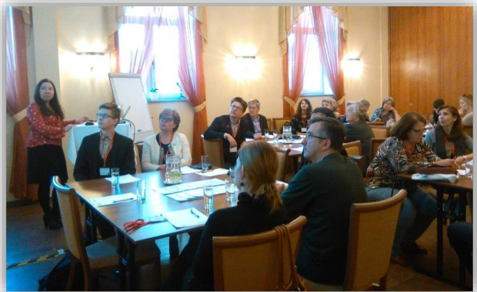
10. maija praktiskās mācības “Studiju virzienu novērtēšanas praktiskie aspekti”