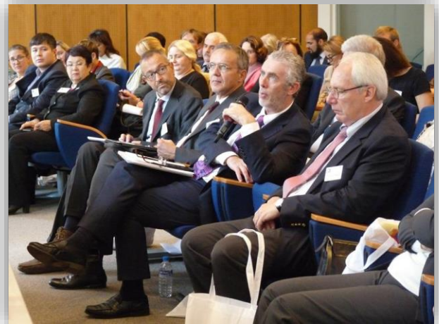
ENQA Ģenerālasambleja (26-27. oktobris) Sevres. Franciia